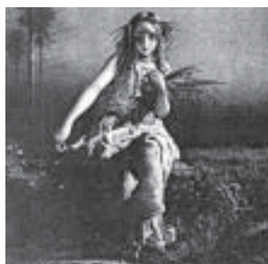
Ofelia: "Och kommer han aldrig igen?" Gravyr från målning av Arthur Hughes